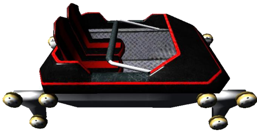
Doc 3 : Fiche technique des wagons