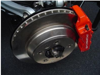
Doc 4 : Système de freinage

Le frein à disque est un système utilisant un disque, fixé sur le moyeu de la roue, et des plaquettes , venant frotter de chaque côté du disque.