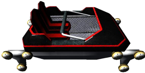
Doc 3 : Fiche technique des wagons